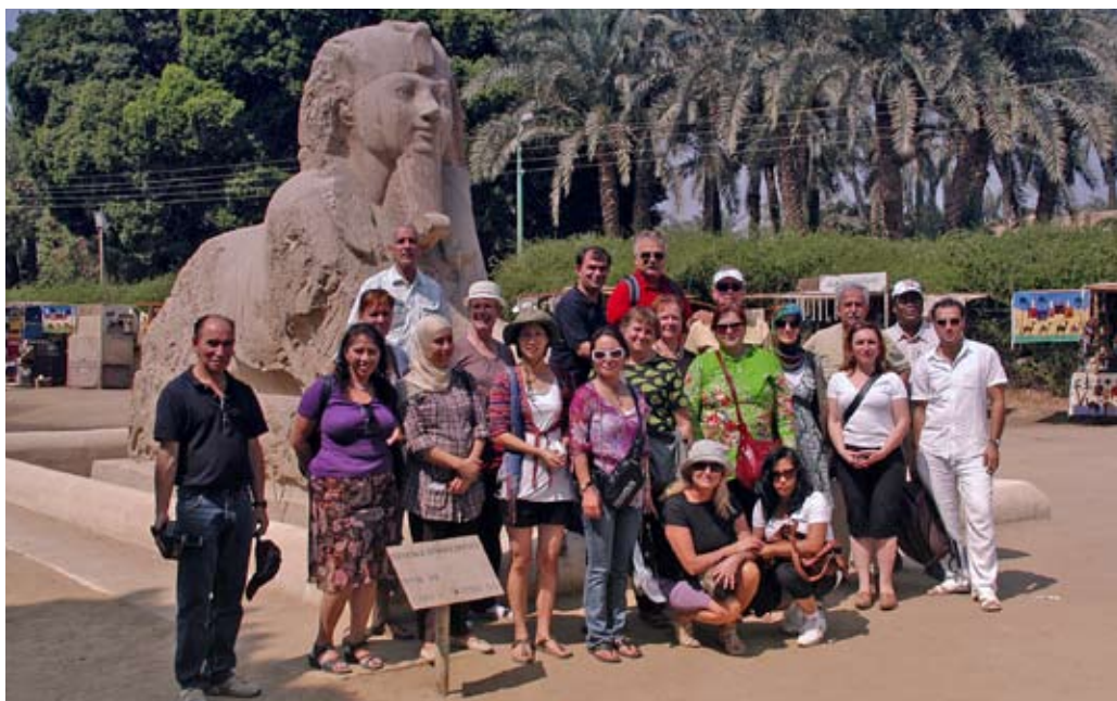
In 2009 ging het NMI op reis naar Egypte en bezocht daar onder meer remigranten en vluchtelingen.